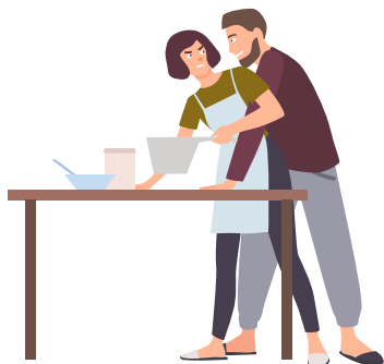
Hombre que toca a una mujer sin su permiso.