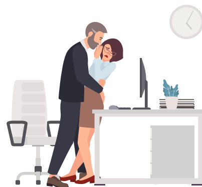
Hombre que toca a una mujer sin su permiso.

Prejuicio: Idea y opinión negativa sobre algo o alguien antes de conocerlo y sin motivo concreto.