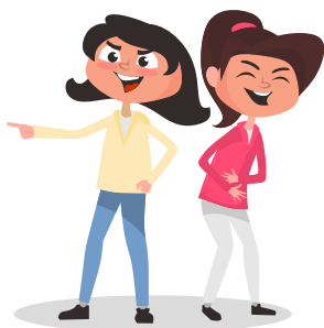
Persona chillando a otra.