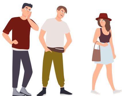
Chicos molestando con piropos a una chica.